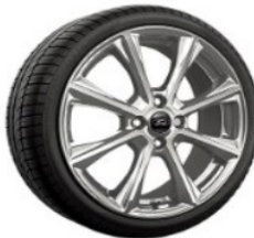
Prémiové 18" disky Vignale D2UA8