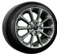
Štandardné 17" disky Vignale